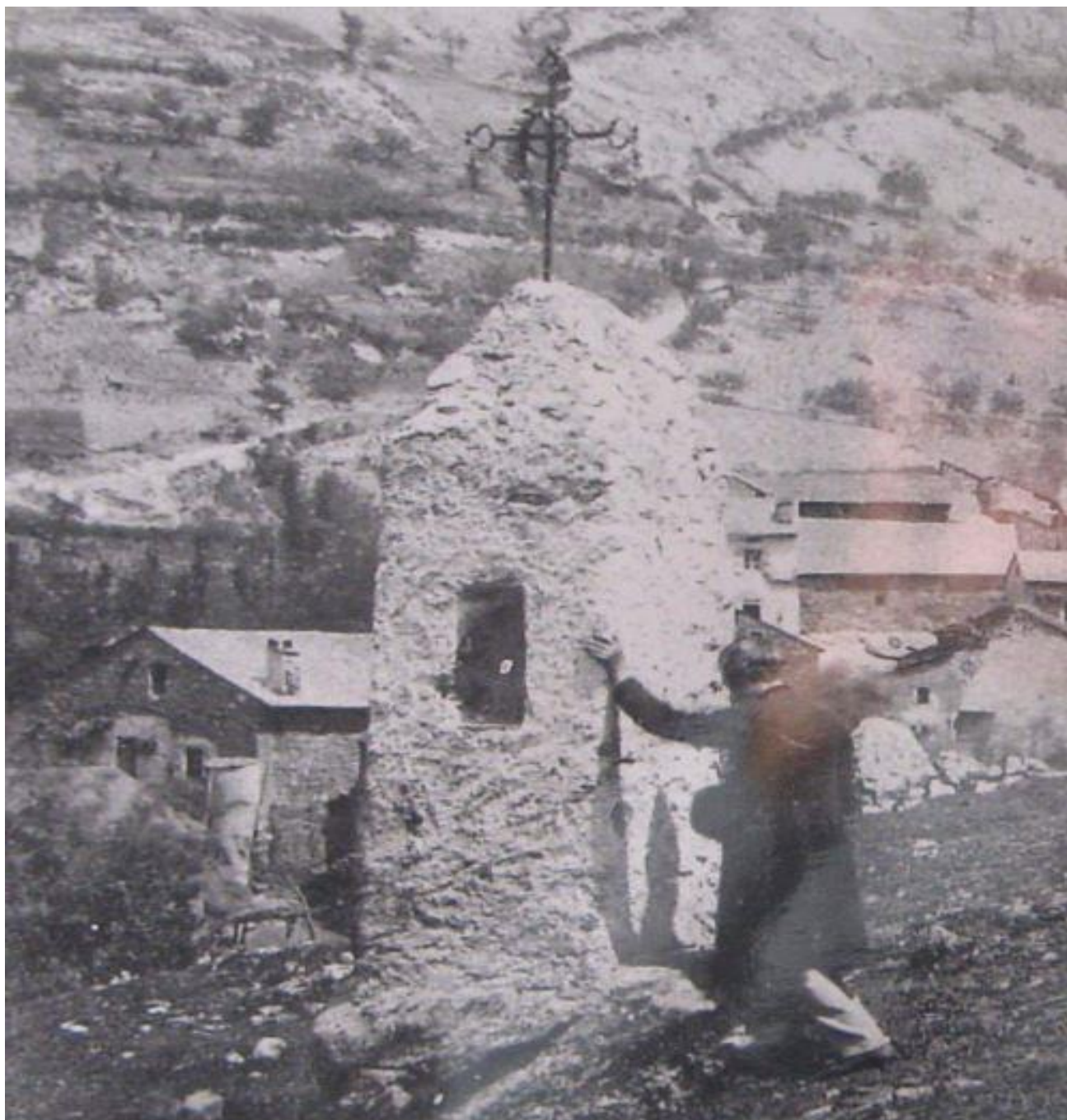
Photo anonyme aux alentours de 1900 On distingue parfaitement les terminaisons en lyre et la couronne tout en notant un revêtement sur le bâti