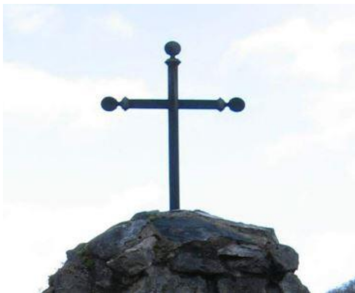
Avant restauration fin 2015