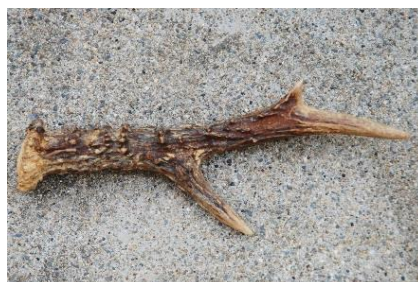
Bois de chevreui.