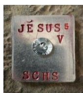
Marquage "Jésus V".