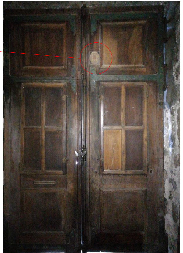
Portail fermé vu de l'intérieur de la Chapelle.