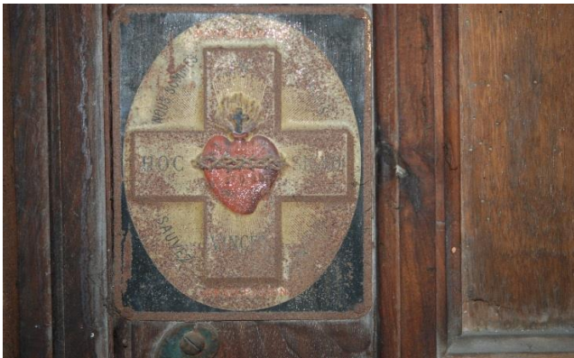
La plaque commémorative en place, clouée.